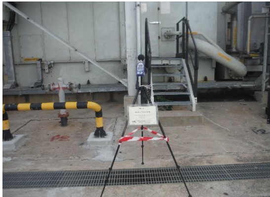
รูปที่ 2-8 การติดตามตรวจสอบระดับเสียง