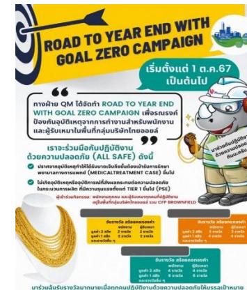
รูปที่ 2-13 กิจกรรมสัปดาห์ความปลอดภัย