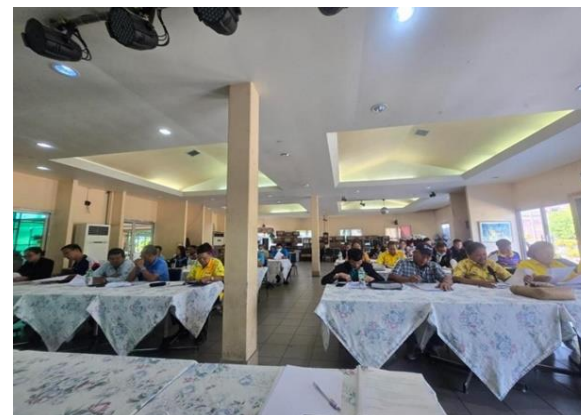
รูปที่ 2-6 การประชาสัมพันธ์ข้อมูลโครงการ