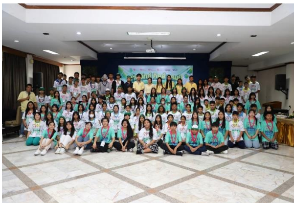
รูปที่ 2-5 (ต่อ) โครงการสนับสนุนและพัฒนาชุมชนด้านต่าง ๆ