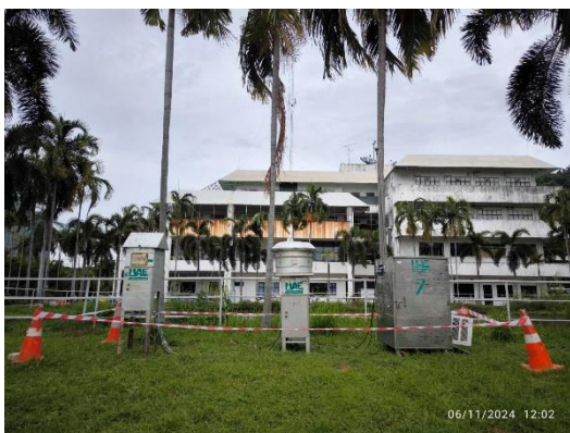
รูปที่ 2-3 การติดตามตรวจสอบคุณภาพอากาศในบรรยากาศ