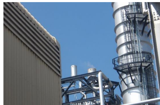
รูปที่ 2-7 โครงการติดตั้ง Silencers จำนวน 5 แห่ง