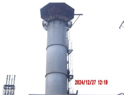
รูปที่ 2-1 ปล่องระบายอากาศเสียสูง 30 เมตร