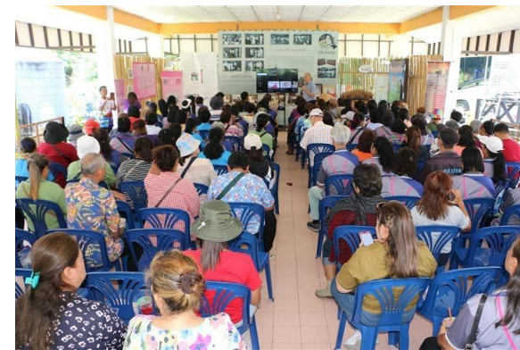
รูปที่ 2-5 (ต่อ) โครงการสนับสนุนและพัฒนาชุมชนด้านต่าง ๆ