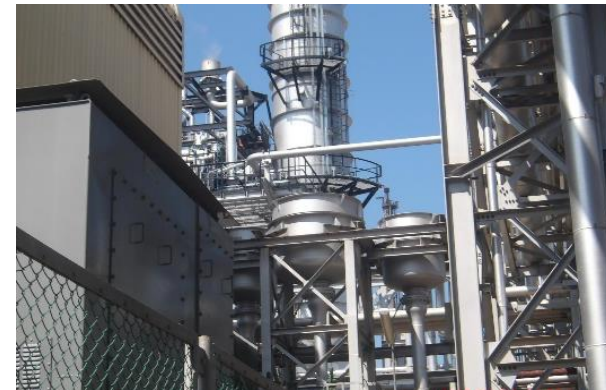
รูปที่ 2-7 (ต่อ) โครงการติดตั้ง Silencers จำนวน 5 แห่ง