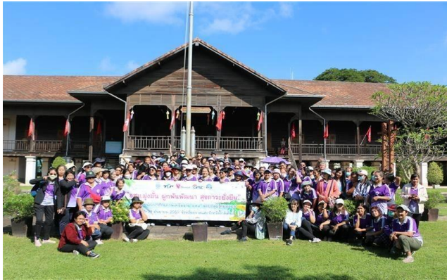
รูปที่ 2-4 (ต่อ) ตัวอย่างโครงการที่ให้การสนับสนุนในการปรับปรุงสิ่งแวดล้อม