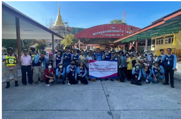
รูปที่ 2-5 (ต่อ) โครงการสนับสนุนและพัฒนาชุมชนด้านต่าง ๆ