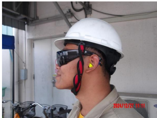
รูปที่ 2-10 ป้ายเตือนให้สวมปลั๊กอุดหู (Ear Plugs) หรือที่ครอบหู (Ear Muffs)