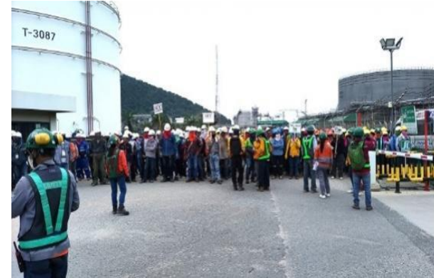
รูปที่ 2-11 การฝึกซ้อมแผนฉุกเฉิน