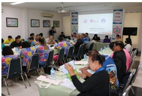
รูปที่ 2-6 (ต่อ) การประชาสัมพันธ์ข้อมูลโครงการ