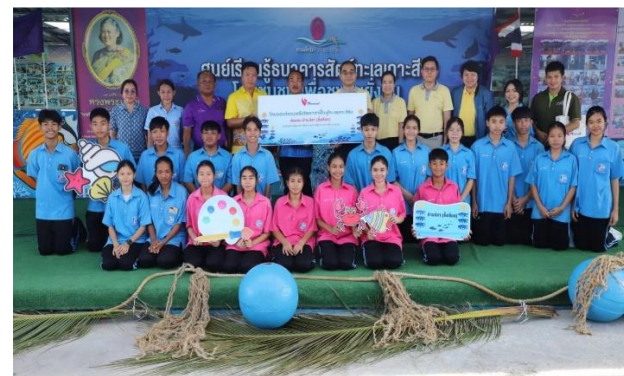
รูปที่ 2-4 ตัวอย่างโครงการที่ให้การสนับสนุนในการปรับปรุงสิ่งแวดล้อม