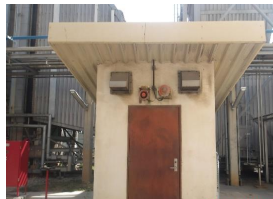
รูปที่ 2-2 ระบบตรวจสอบคุณภาพอากาศแบบต่อเนื่อง (CEMS)