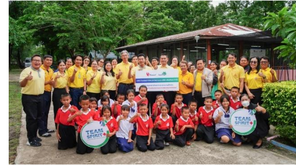
รูปที่ 2-5 โครงการสนับสนุนและพัฒนาชุมชนด้านต่าง ๆ