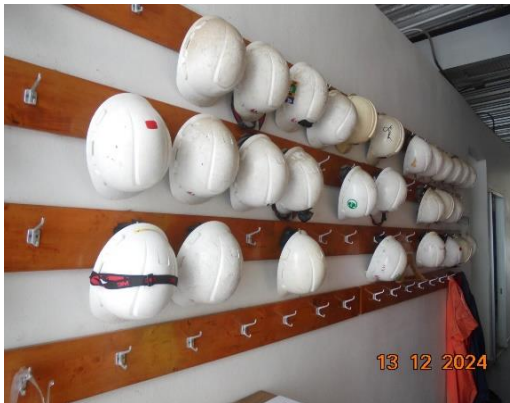
รูปที่ 2-12 อุปกรณ์ด้านความปลอดภัย